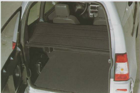
Cache-bagages Minivan 500.4