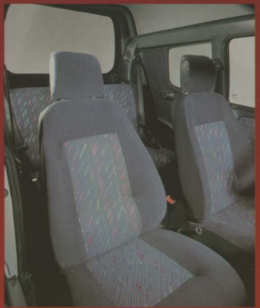
Sièges ergonomiques Minivan 500.5 - 4 places.