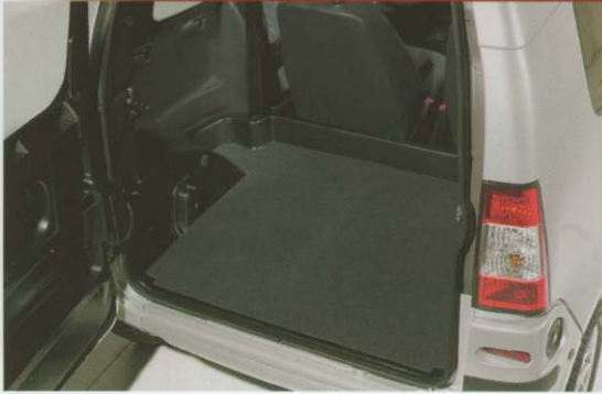
Coffre Minivan 500.4