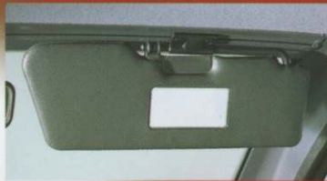
Pare-soleil orientable avec miroir de courtoisie côté passager.