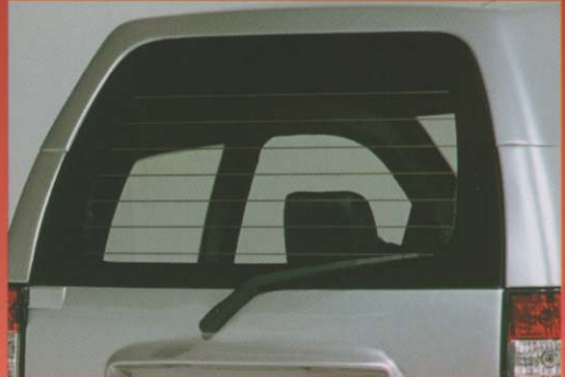
Lunette arrière dégivrante avec essuie-glace.