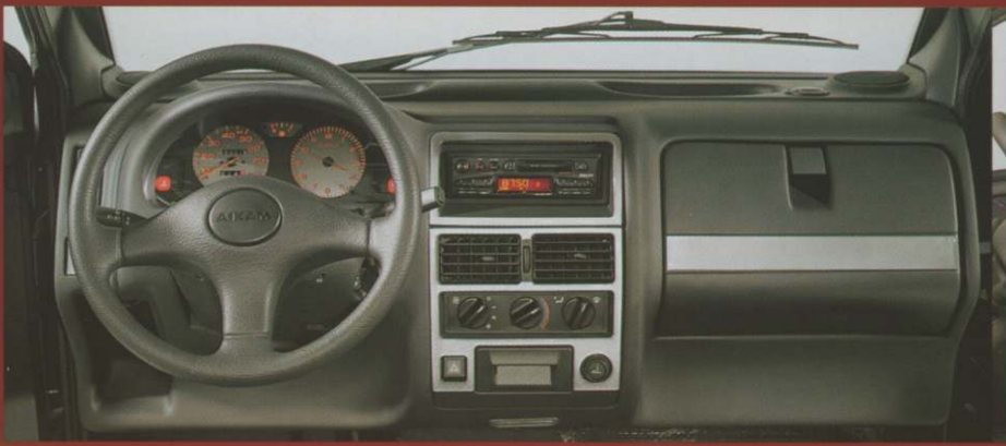
Tableau de bord : instrumentation très complète et sophistiquée, modèle SUPER LUXE.