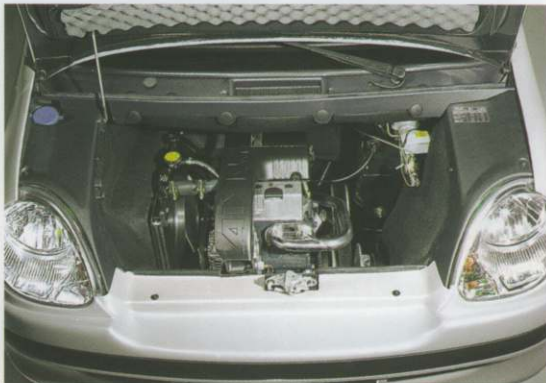
Le moteur KUBOTA spécifique AIXAM et son insonorisation.