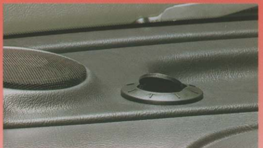
Bouche d'aération orientable pour dégivrage des vitres latérales.