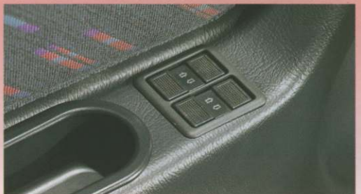
Commande de vitres électriques.