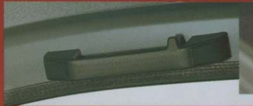
Poignée de maintien passager.