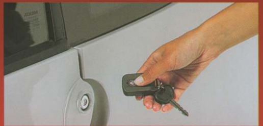
Fermeture centralisée avec télécommande.