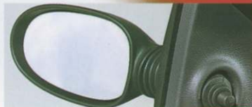
Rétroviseurs réglables de l'intérieur.